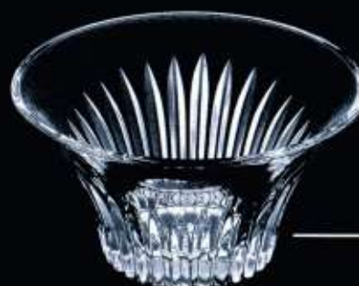
24052 ø 135 mm H. 70 mm