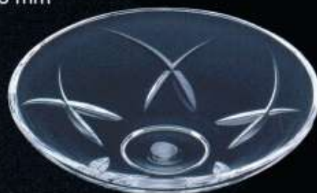
20356 ø 150 mm H. 45 mm