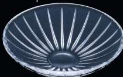
21357 ø 160 mm H. 50 mm