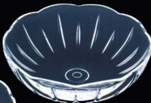
23164 ø 200 mm H. 60 mm