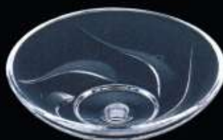
20241 ø 110 mm H. 35 mm