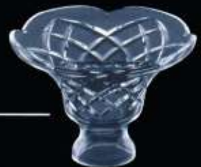
2US52 ø 135 mm H. 80 mm