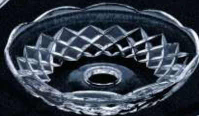
2US64 ø 200 mm H. 42 mm