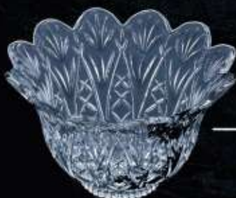
2B259 ø 170 mm H. 100 mm