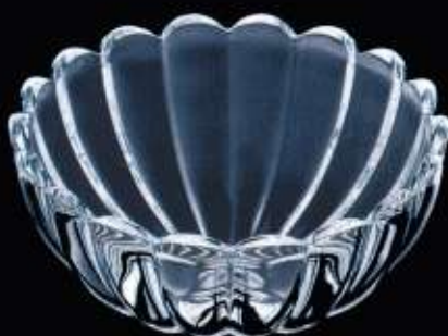
2A557 ø 160 mm H. 72 mm