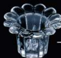
123BQ ø 80 mm H. 53 mm