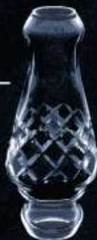
41US ø 60 mm H. 137 mm