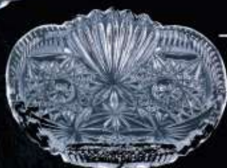
25136 ø 100 mm H. 25 mm