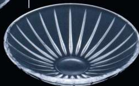
21364 ø 200 mm H. 70 mm