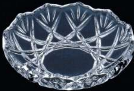
2A357 ø 160 mm H. 40 mm