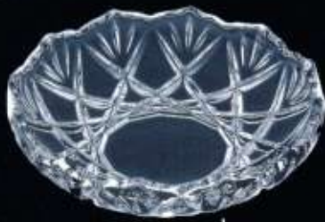
2A351 ø 130 mm H. 35 mm