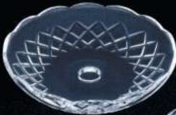
2US56 ø 150 mm H. 35 mm