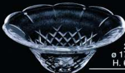
2US59 ø 170 mm H. 65 mm