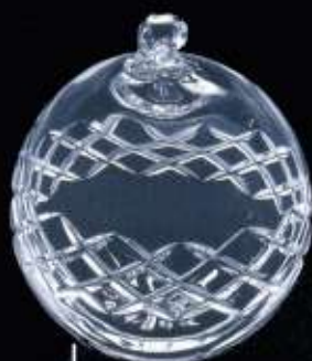
4201 ø 100 mm H. 113 mm