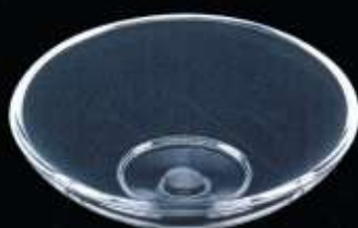
20141 ø 110 mm H. 35 mm