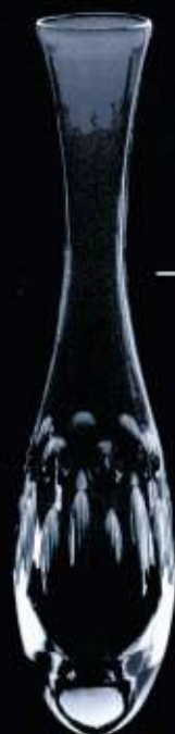
4140 ø 50 mm H. 210 mm