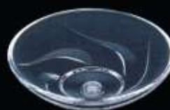
20223 ø 80 mm H. 22 mm