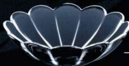
2B449 ø 125 mm H. 40 mm