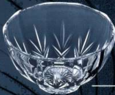
28102 ø 150 mm H. 85 mm base