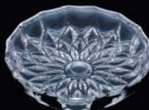
25238 ø 105 mm H. 20 mm