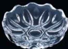
28247 ø 120 mm H. 35 mm