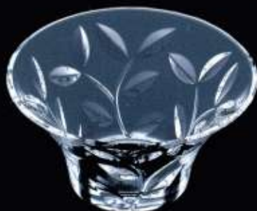
27352 ø 135 mm H. 70 mm