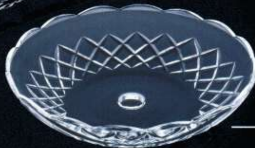
2US73 ø 250 mm H. 55 mm