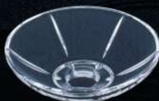
20841 ø 110 mm H. 35 mm