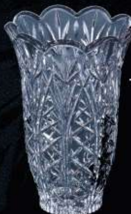
4293 ø 125 mm H. 175 mm