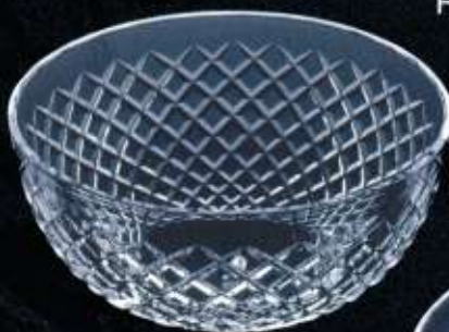
2USA6 ø 200 mm H. 100 mm