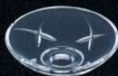
20323 ø 80 mm H. 22 mm