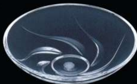
20256 ø 150 mm H. 45 mm