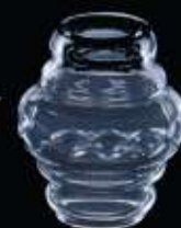
41US ø 60 mm H. 65 mm