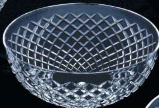
2USA7 ø 250 mm H. 110 mm