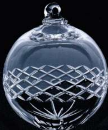
4201 ø 140 mm H. 168 mm