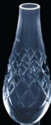
41US ø 65 mm H. 160 mm