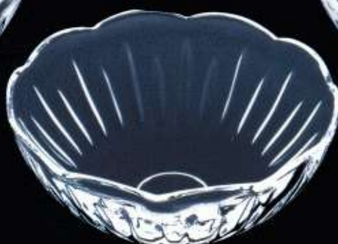
23156 ø 150 mm H. 55 mm