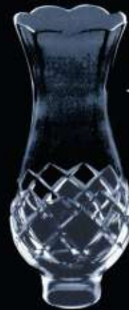
410B ø 90 mm H. 210 mm