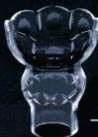
41US ø 70 mm H. 80 mm