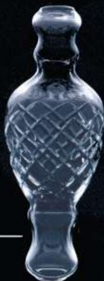
41US ø 95 mm H. 257 mm