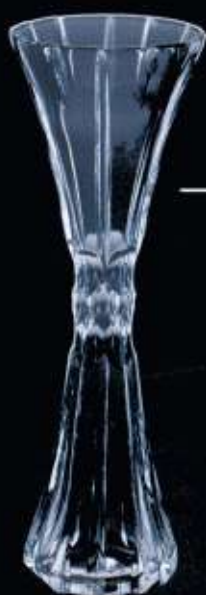
4144 ø 83 mm H. 230 mm