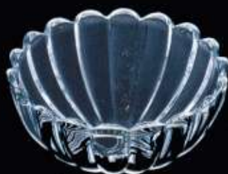
2A551 ø 130 mm H. 60 mm