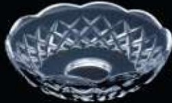
2US36 ø 100 mm H. 27 mm