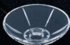
20823 ø 80 mm H. 22 mm