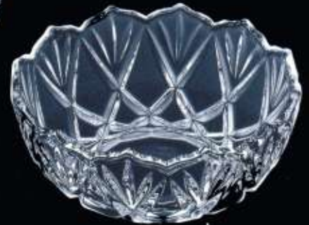
2A457 ø 160 mm H. 70 mm