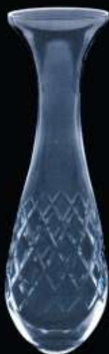
41US ø 65 mm H. 210 mm