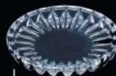
29323 ø 90 mm H. 13 mm