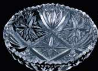
25036 ø 100 mm H. 25 mm