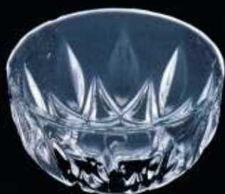
23041 ø 110 mm H. 55 mm