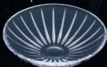
21349 ø 125 mm H. 35 mm