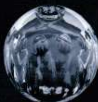
4230 ø 60 mm H. 55 mm