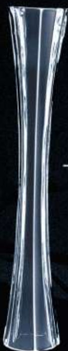
C14022 ø 70 mm H. 180 mm