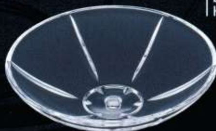
20856 ø 150 mm H. 45 mm