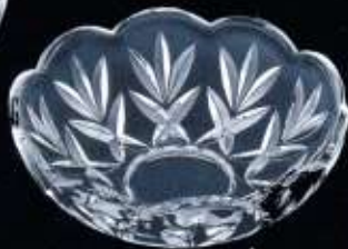
2C336 ø 100 mm H. 32 mm