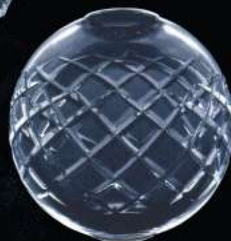
42US ø 150 mm H. 150 mm