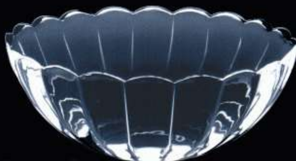
2B468 ø 220 mm H. 90 mm