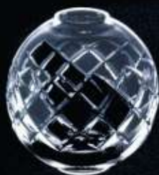
42US ø 80 mm H. 78 mm