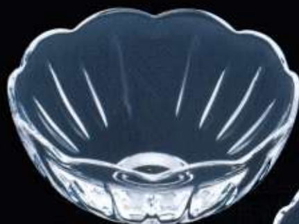
23144 ø 115 mm H. 50 mm