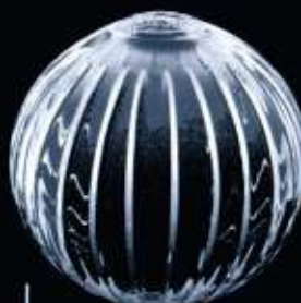
4213 ø 80 mm H. 75 mm