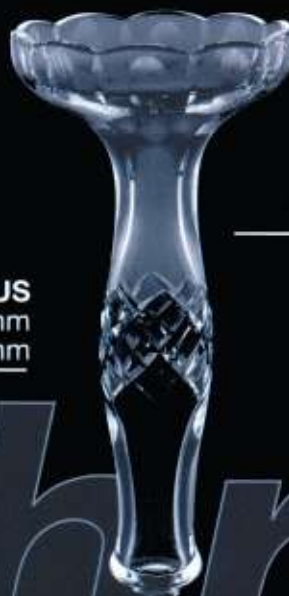
41US ø 135 mm H. 260 mm