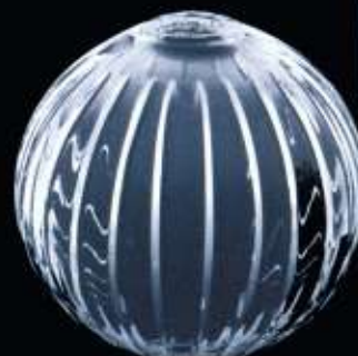
4213 ø 100 mm H. 95 mm