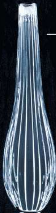
4113 ø 70 mm H. 265 mm