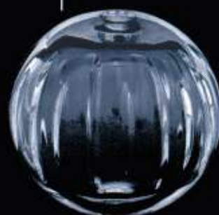
4230 ø 100 mm H. 95 mm