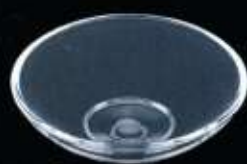
20123 ø 80 mm H. 22 mm