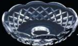
2US47 ø 120 mm H. 32 mm