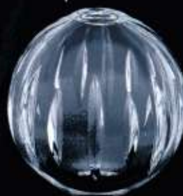
4230 ø 80 mm H. 75 mm