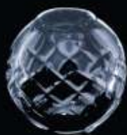
42US ø 60 mm H. 58 mm