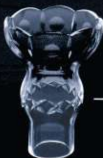
41US ø 76 mm H. 100 mm