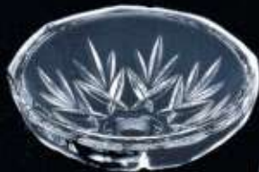
28129 ø 90 mm H. 30 mm cover