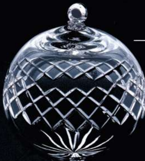
4201 ø 200 mm H. 225 mm