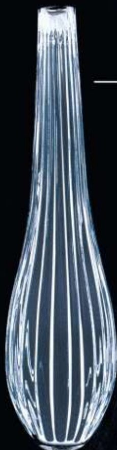
4113 ø 90 mm H. 350 mm