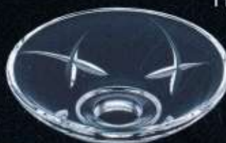
20341 ø 110 mm H. 35 mm