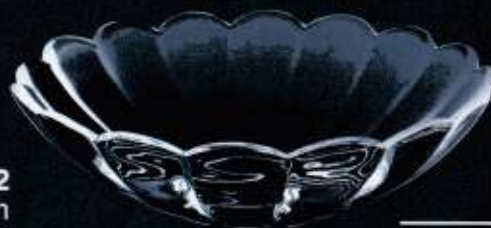
2B457 ø 160 mm H. 48 mm