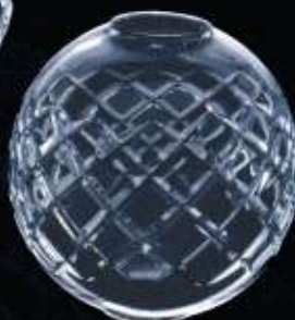
42US ø 120 mm H. 120 mm