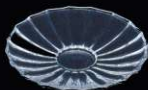
27238 ø 105 mm H. 11 mm