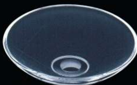
20156 ø 150 mm H. 45 mm