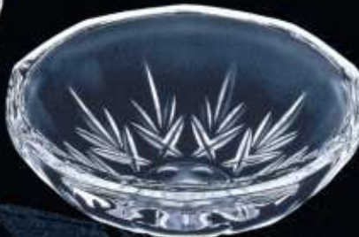
28156 ø 150 mm H. 50 mm cover