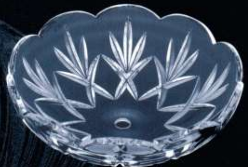
2D363 ø 190 mm H. 65 mm