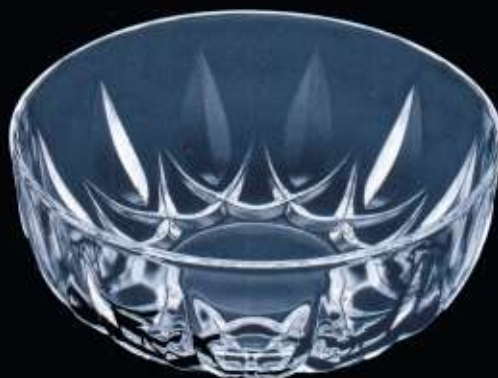
23066 ø 210 mm H. 80 mm