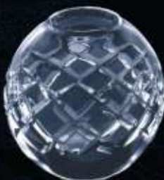
42US ø 100 mm H. 100 mm