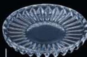
29341 ø 110 mm H. 14 mm